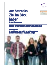
Am Start das Ziel im Blick haben – Unterrichtsmaterial zum Themenkomplex Sterben, „Sterbehilfe“, Hospizarbeit und Palliativversorgung 20 €, kostenfrei innerhalb Hessens (zzgl. Versandkosten)

Dank wechselnder Spender sind die Titel so preiswert oder sogar kostenlos. Bestellungen und Download unter www.palliativstiftung.de