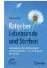
Ratgeber Lebensende und Sterben 274 Seiten, 24,99 €