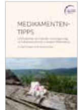
Medikamententipps 195 Seiten, 10 €