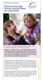
Gesprächshilfe für Angehörige von Menschen mit Demenz kostenfrei (zzgl. Versandkosten)