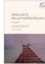
Ambulante Palliativversorgung 283 Seiten, 10 €