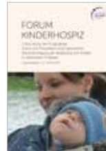
Forum Kinderhospiz 104 Seiten, 10 €