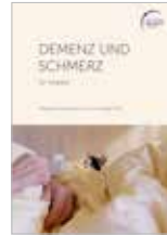
Demenz und Schmerz 70 Seiten, 5 €, innerhalb Hessens kostenfrei (zzgl. Versandkosten)