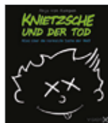
Anja von Kampen „Knietsche und der Tod“ 122 Seiten, 19,95 €