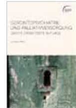
Gerontopsychiatrie und Palliativversorgung 137 Seiten, 10 €