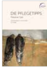
Die Pflegetipps 85 Seiten, mit Anmerkungen aus islamischer Sicht, in 22 Sprachen erhältlich, kostenfrei (zzgl. Versandkosten)