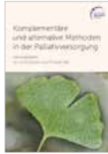
Komplementäre und alternative Methoden in der Palliativversorgung 112 Seiten, 5 €